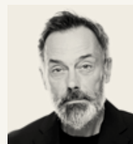
DR. RELLING Spilt av Håkon Ramstad