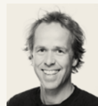
MOLVIK Spilt av Bernhard Arnø