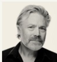
GROSSERER WERLE Spilt av Kim Haugen